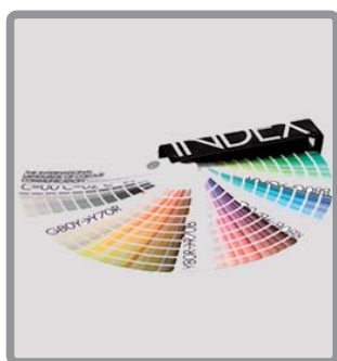
NCS Index 1950 Original

Cartella a ventaglio che fornisce una semplice e pratica panoramica della collezione dei colori NCS. La disposizione dei colori in base alla tonalità permette di avere una chiara suddivisione tra grigi, gialli (G80Y - Y70R), rossi (Y80R - R70B), blu (R80B - B70G) e verdi (B80G - G70Y).