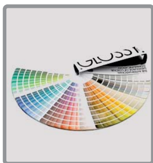
NCS Glossy Index 1950 Original

Cartella a ventaglio che contiene tutti i 1950 colori standard NCS in versione glossy e permette una scelta precisa dei colori per le superfici e materiali lucidi. Come nella cartella NCS Index 1950 Original, i colori sono divisi in cinque gruppi e disposti per tonalità.