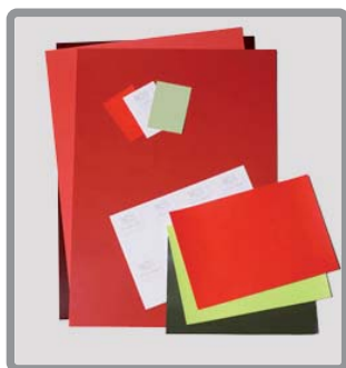
NCS Colour Samples 1950 Original

Campioni colore singoli disponibili in formato A4, A6 e A9. Tutti i campioni sono controllati e certificati da NCS Quality Centre in relazione ai parametri del Quality Level 1. Sul retro di ogni campione è indicata la relativa notazione NCS.